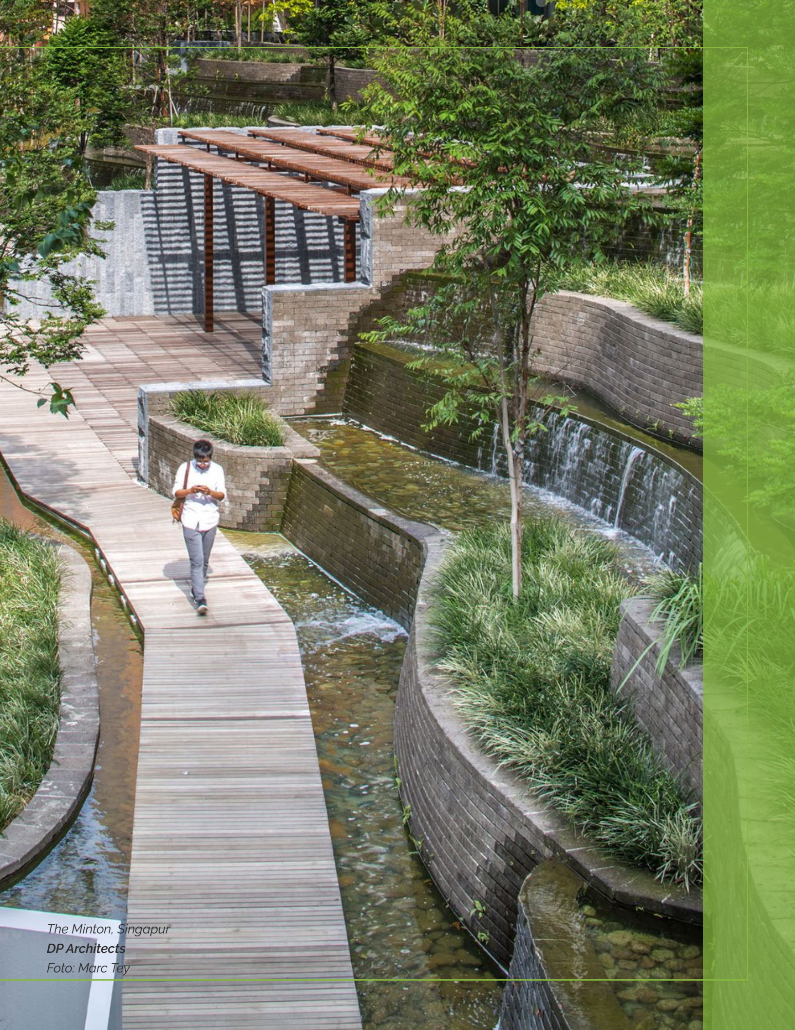
The Minton, Singapur DP Architects