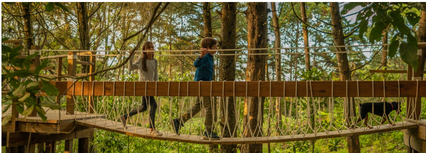
Corredor Verde, Legado del Bosque, Guatemala.

Al igual que en Panamá, en Latinoamérica nuevas dinámicas afectan el territorio: el crecimiento de la población, el desarrollo inmobiliario, las nuevas infraestructuras viales y de transporte, entre otros, comienzan a demarcar zonas de riesgo y de vulnerabilidad afectando el bienestar de las comunidades. Esta condición de transformación constante del territorio puede convertirse en una amenaza para el ambiente y los recursos naturales si no se toman las decisiones adecuadas que permitan mantener el equilibrio entre los diferentes actores y el medio natural. Desde lo académico y lo profesional y la formación de las nuevas generaciones, una oportunidad para reconocer en el paisaje un campo de acción para el diseño, la gestión adecuada de intervenciones en las zonas afectadas, permitira ajustarlas a los requerimientos actuales y preveer las dinámicas que se necesiten para mantener el equilibrio en el futuro.