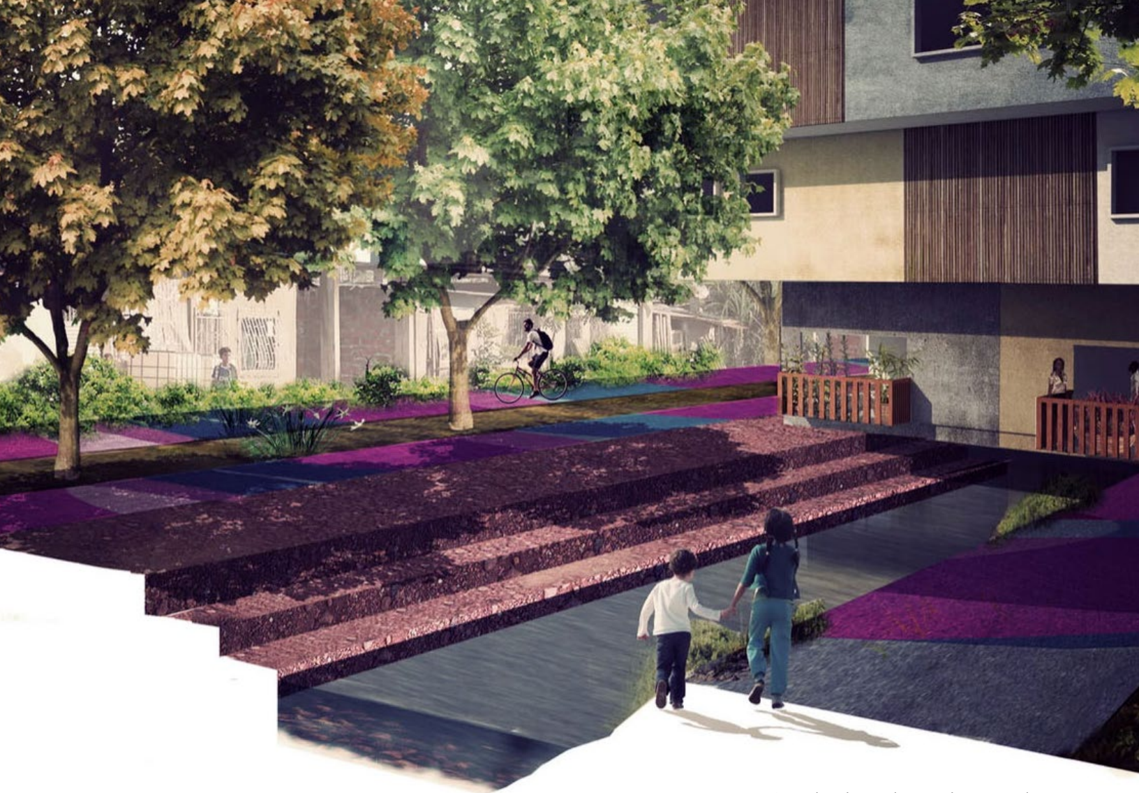
Canal 5 de Junio, Durán, Ecuador.